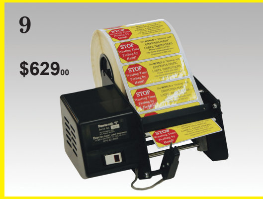
9. Dispensa-Matic "6-II" - Dispensador para etiquetas en rollo o zig-zag de hasta 5,5" (140 mm) de ancho. El dispositivo se carga MUY rápidamente y el material sobrante no entorpece su funcionamiento. Resulta ideal para rollos de gran diámetro y para situaciones en las que se recomienda utilizar una velocidad constante (velocidad de avance: 6"/152 mm por segundo).

Bottle-Matic es el dispositivo ideal para etiquetar objetos cilíndricos. Con solo presionar el interruptor de tipo pedal, podrá adherir etiquetas a botellas, latas, objetos tubulares y botes. Incluso funciona con objetos ahusados y surcados. Si su lata o botella presenta una forma poco habitual, podemos modificar el dispositivo para que se adapte a sus necesidades específicas. El servicio de personalización del Bottle-Matic se factura por hora y si no queda satisfecho, NO le cobraremos importe alguno. Solo tiene que enviarnos el objeto en cuestión junto con un rollo de las etiquetas que desea colocar.