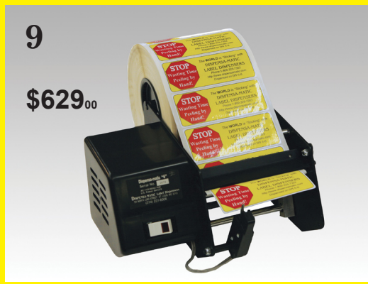
9. Dispensa-Matic "6-II" - für Rollenetiketten oder Etiketten mit Leporellofaltung bis zu einer Breite von 140 mm (5,5 Zoll). Kein Aufwickeln von Folienabfall und SEHR schnelle Zuführung. Für Rollen mit großem Durchmesser und für konstanten Durchsatz geeignet. (Vorschub 152 mm (6 Zoll) pro Sekunde)

Bottle-Matic ist das perfekte Gerät für die Etikettierung Ihrer zylindrischen Behälter bzw. Gegenstände. Durch einfaches Betätigen des Fußschalters werden Ihre Flaschen, Dosen, Tuben und Gläser etikettiert. Auch für kegelförmige Behälter geeignet! Wir können die Rollen selbst für den Einsatz von gerillten Behältern entsprechend anpassen. Die individuelle Anpassung Ihres Bottle-Matic wird auf Stundenbasis abgerechnet und sollte uns die Anpassung nicht gelingen, entstehen Ihnen KEINE Kosten! Senden Sie uns einfach einen Muster-Behälter und eine Rolle mit den entsprechenden Etiketten.